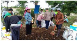
การผลิตปุ๋ยหมักจากเศษวัสดุเหลือใช้จากการเกษตร ด้วยการผลิตปุ๋ยอินทรีย์ชีววิศวกรรมแม่โจ้