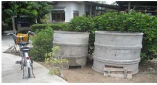
สนับสนุนทอวบ่อในการกำจัดขยะอินทรีย์หรือขยะย่อยสลายง่าย

ขยะอินทรีย์หรือขยะย่อยสลายง่ายสนับสนุนทอวบ่อในการกำจัดขยะอินทรีย์หรือขยะย่อยสลายง่าย เช่น เศษอาหาร เศษผักและผลไม้ ฯลฯ โดยลงพื้นที่ประชุมชี้แจงและให้ความรู้โดยเจ้าหน้าที่วิทยากรหมู่บ้านโดยมีกลุ่มเป้าหมายเป็นผู้ที่สมัครเข้าร่วมโครงการในปีงบประมาณ 2558, 2552 และ 2556 รวมทั้งสิ้น 700 รายซึ่งผู้เข้าร่วมกิจกรรมส่วนใหญ่มีความรู้ความเข้าใจเพิ่มขึ้นและสามารถใช้ทอวบ่อได้อย่างถูกต้องและ จัดตั้งกลุ่มและดำเนินการผลิตปุ๋ยหมักจากเศษวัสดุเหลือใช้จากการเกษตร ด้วยการผลิตปุ๋ยอินทรีย์ชีววิศวกรรมแม่โจ้ 1 ทุกหมู่บ้าน