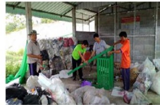
กระบวนการคัดแยกพลาสติกเพื่อขายให้กับบริษัท