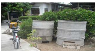
สนับสนุนทอวบ่อในการกำจัดขยะอินทรีย์หรือขยะย่อยสลายง่าย

ขยะอินทรีย์หรือขยะย่อยสลายง่ายสนับสนุนทอวบ่อในการกำจัดขยะอินทรีย์หรือขยะย่อยสลายง่าย เช่น เศษอาหาร เศษผักและผลไม้ ฯลฯ โดยลงพื้นที่ประชุมชี้แจงและให้ความรู้โดยเจ้าหน้าที่วิทยากรหมู่บ้านโดยมีกลุ่มเป้าหมายเป็นผู้ที่สมัครเข้าร่วมโครงการในปีงบประมาณ 2558, 2552 และ 2556 รวมทั้งสิ้น 700 รายซึ่งผู้เข้าร่วมกิจกรรมส่วนใหญ่มีความรู้ความเข้าใจเพิ่มขึ้นและสามารถใช้ทอวบ่อได้อย่างถูกต้องและ จัดตั้งกลุ่มและดำเนินการผลิตปุ๋ยหมักจากเศษวัสดุเหลือใช้จากการเกษตร ด้วยการผลิตปุ๋ยอินทรีย์ชีววิศวกรรมแม่โจ้ 1 ทุกหมู่บ้าน