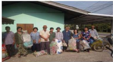
ผู้สูงอายุขยะรีไซเคิลมาบริจาคในวันแยกขยะอินทรีย์เป็นประจำทุกเดือน