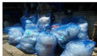
ถุงดำขายสำหรับณรงค์คัดแยกขยะมูลฝอยประเภทพลาสติกในครัวเรือน

ขยะทั่วไปมีการสนับสนุนถุงดำขายสำหรับณรงค์คัดแยกขยะมูลฝอยประเภทพลาสติกในครัวเรือนคัดแยกขยะภายในครัวเรือนและนำขยะพลาสติกมารวบรวมในวันรับเยี่ยยังชีพเป็นประจำทุกเดือน โดยมีแกนนำหรือคณะทำงานในชุมชนเป็นผู้ตรวจสอบและสนับสนุนการปฏิบัติงานของเจ้าหน้าที่จากเทศบาลในการเก็บขนและนำไปยังจุดปฏิบัติการเพื่อคัดแยกก่อนพลาสติกและขายให้กับบริษัท กรีนไลน์ เอ็นเนอจี้ (ประเทศไทย) จำกัด ซึ่งเป็นบริษัทผลิตกระแสไฟฟ้าและผลิตเชื้อเพลิงจากวัสดุเหลือใช้ ในอัตราที่โลกรัมละ 2 บาท ซึ่งก็จะนำเงินที่ได้จากการดำเนินการดังกล่าวมาจัดสวัสดิการในชุมชนต่อไป