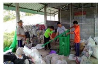
กระบวนการคัดแยกพลาสติกเพื่อขายให้กับบริษัท