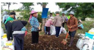
การผลิตปุ๋ยหมักจากเศษวัสดุเหลือใช้จากการเกษตร ด้วยการผลิตปุ๋ยอินทรีย์ชีววิศวกรรมแม่โจ้