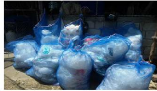
ถุงดำขายสำหรับณรงค์คัดแยกขยะมูลฝอยประเภทพลาสติกในครัวเรือน

ขยะทั่วไปมีการสนับสนุนถุงดำขายสำหรับณรงค์คัดแยกขยะมูลฝอยประเภทพลาสติกในครัวเรือนคัดแยกขยะภายในครัวเรือนและนำขยะพลาสติกมารวบรวมในวันรับเยี่ยยังชีพเป็นประจำทุกเดือน โดยมีแกนนำหรือคณะทำงานในชุมชนเป็นผู้ตรวจสอบและสนับสนุนการปฏิบัติงานของเจ้าหน้าที่จากเทศบาลในการเก็บขนและนำไปยังจุดปฏิบัติการเพื่อคัดแยกก่อนพลาสติกและขายให้กับบริษัท กรีนไลน์ เอ็นเนอจี้ (ประเทศไทย) จำกัด ซึ่งเป็นบริษัทผลิตกระแสไฟฟ้าและผลิตเชื้อเพลิงจากวัสดุเหลือใช้ ในอัตราที่โลกรัมละ 2 บาท ซึ่งก็จะนำเงินที่ได้จากการดำเนินการดังกล่าวมาจัดสวัสดิการในชุมชนต่อไป