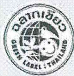
ฉลากเขียว

“ฉลากสิ่งแวดล้อม” คือ ฉลากที่มอบให้แก่สินค้าที่มีคุณภาพ และมีผลกระทบต่อสิ่งแวดล้อมน้อยกว่าสินค้าอื่นๆ ที่เป็นชนิดเดียวกัน