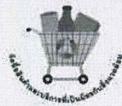
ฉลากตระกร้าเขียว